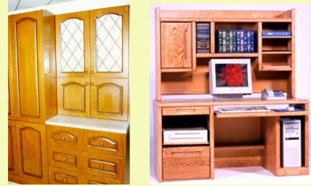
ΕΠΙΠΛΑ - ΞΥΛΟΚΑΤΑΣΚΕΥΕΣ