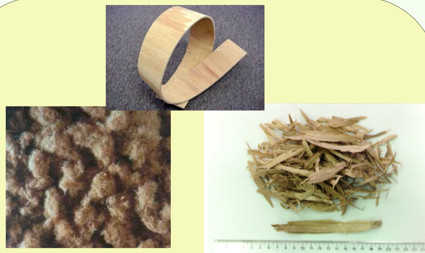
ΑΝΑΚΤΗΣΗ ΞΥΛΩΔΩΝ ΠΡΩΤΩΝ ΥΛΩΝ